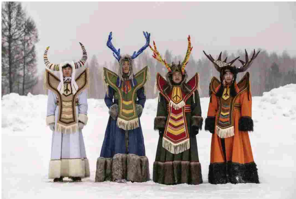
Permafrost #6 © Natalya Saprunova